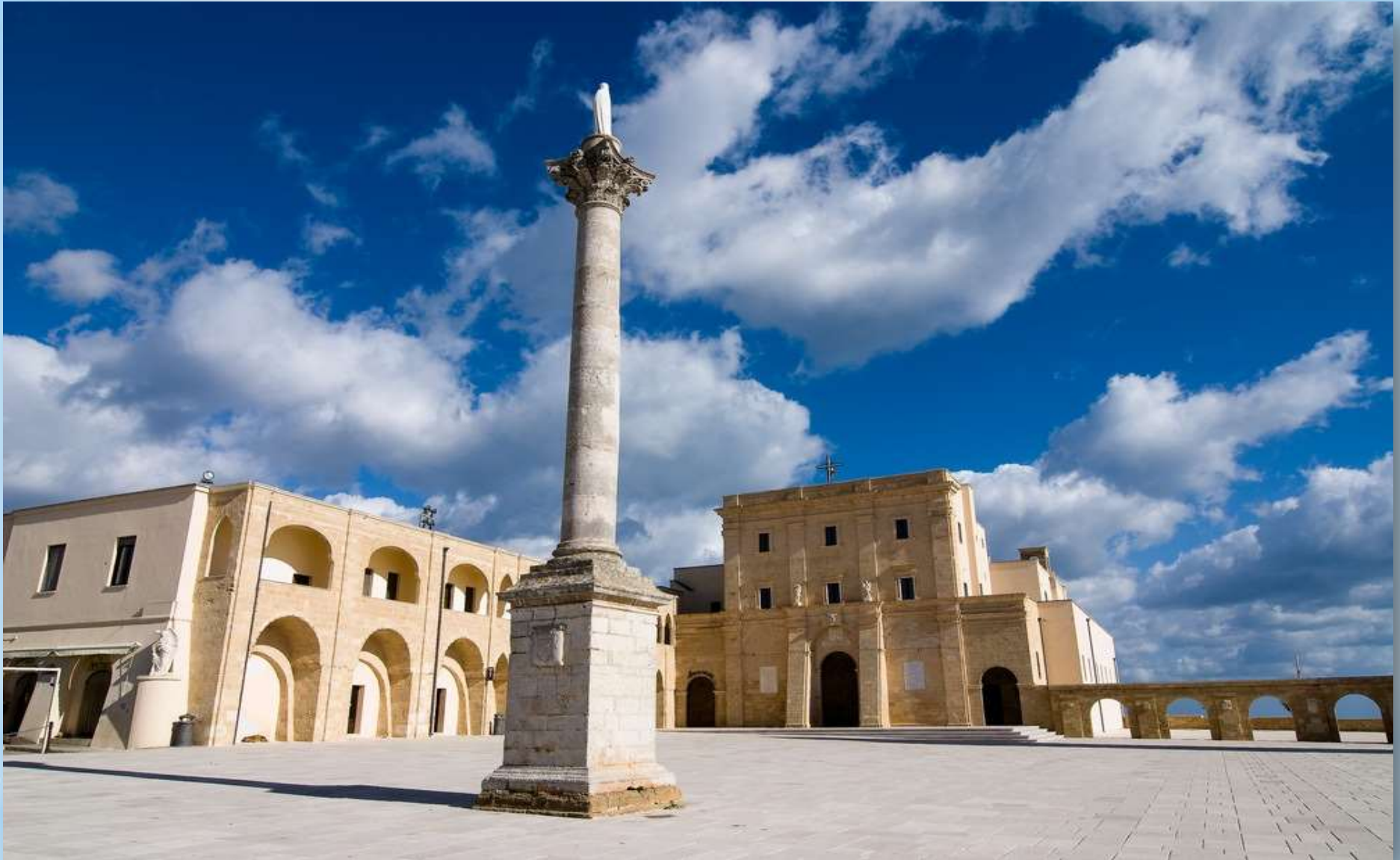
Basilica di Santa Maria Di Leuca de finibus terrae...