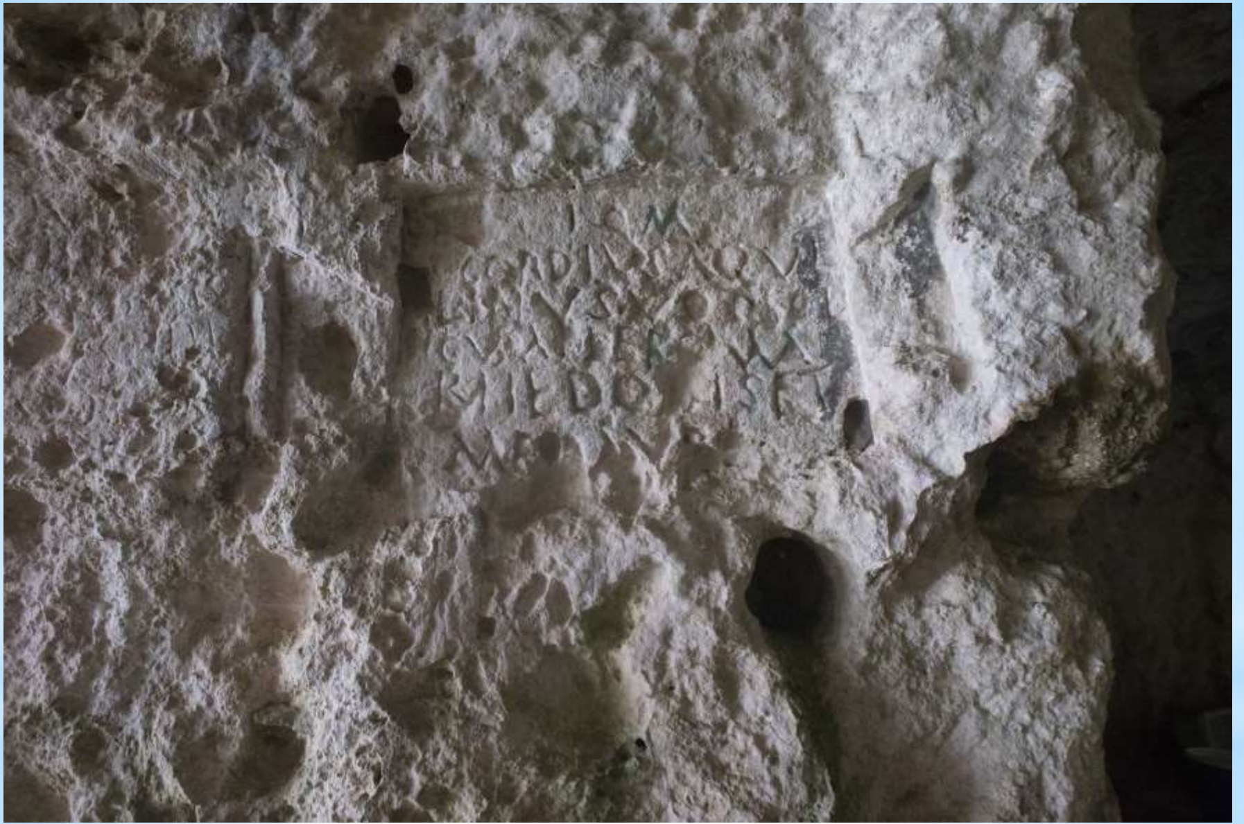
ISCRIZIONE GROTTA PORCINARA